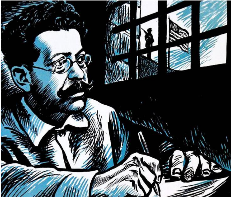
Ricardo Flores Magón encabezó la lucha más firme y la resistencia más larga contra la dictadura de Porfirio Díaz. En cada uno de sus encarcelamientos -que consumieron 21 años de su vida- no dejó de escribir cartas y artículos donde denunció el hambre, la miseria y la injusticia padecidas por el pueblo mexicano.

Ante la agudización de las tensiones entre el gobierno nacional y los magonistas, las autoridades carcelarias norteamericanas, decidieron dar un tratamiento cuidadoso a los revolucionarios mexicanos, quienes para el año 1908, condujeron abiertamente sus ideas, artículos periodísticos y cartas, hacia los terrenos de la lucha armada y el anarquismo. 17